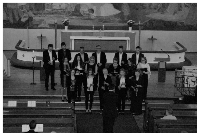
Myös iltamusiikkitalaisuudessa Rovaniemen kirkossa Sukukuoro esiintyi.

Lisää kuvia kesän 2015 sukujuhlsta internetissä sukuseuran sivuilla www.heikkilansukuseura.fi/toiminta/sukujuhlat