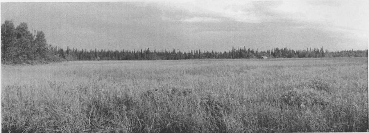
Aittajärven pohjoispää heinäkuussa 2005. Taustalla Heikinsaaren lato, vasemmalla Luusuaansaari.