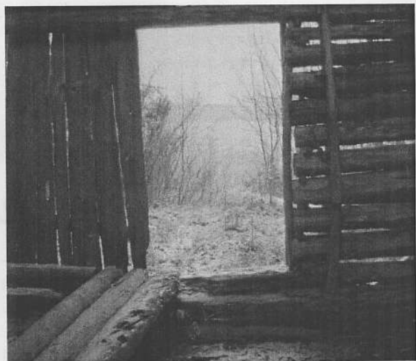
Järven pohjoisreunalla sijaitsevan Luusuanladon ovesta aukenee edelleenkin vapaa näkymä.