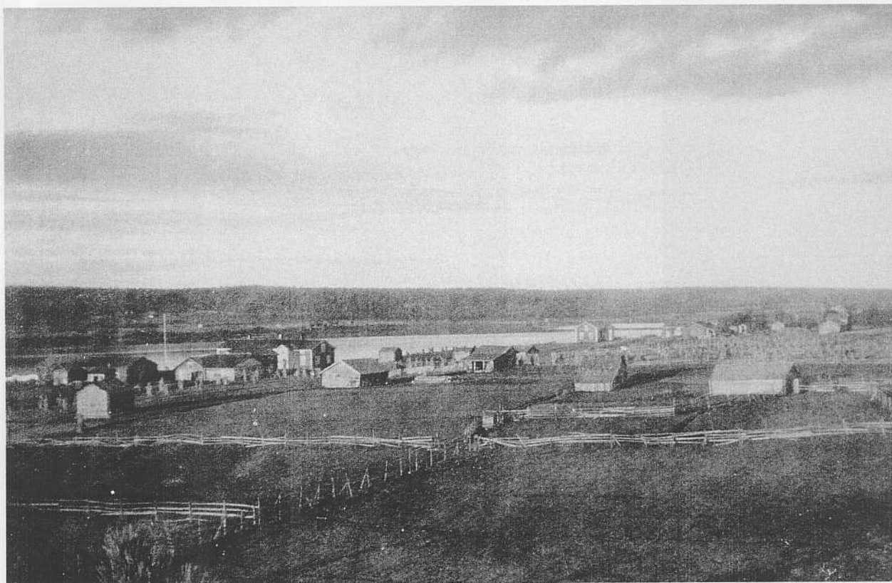
Heikkilänrantaa Rautiosaaresta. Arvo Heikkilän ottama kuva Vuopajan petäjän latvasta v. 1936. Talot Alaheikkilä ja Yliheikkilä.

Tarjous sukukirjasta. 20 € / kirja 100 € / 6 kirjaa