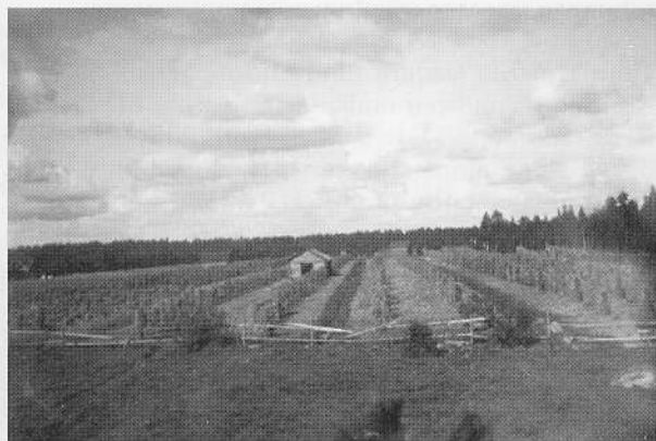
Pikkuhakajängällä viljelyhteitä seipäillä.