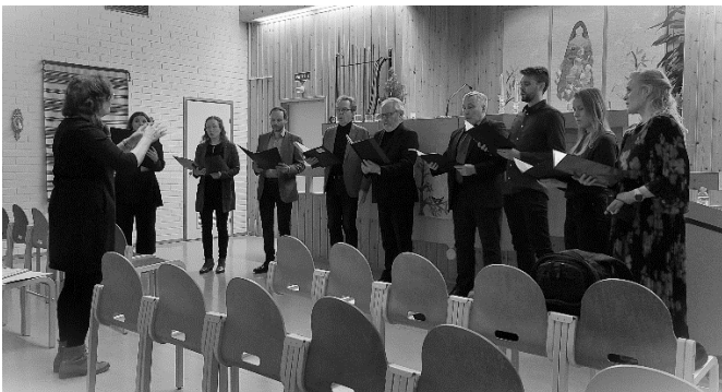
Kauneimmat joululaulut, sukukuoro esiintyy sukujuhlissa 2021

Sukujuhlapäivän ja iltamusiikkitilaisuuden ohjelmaan saattaa tulla vielä tiedotelehden julkaisemisen jälkeen muutoksia ja täydennyksiä.